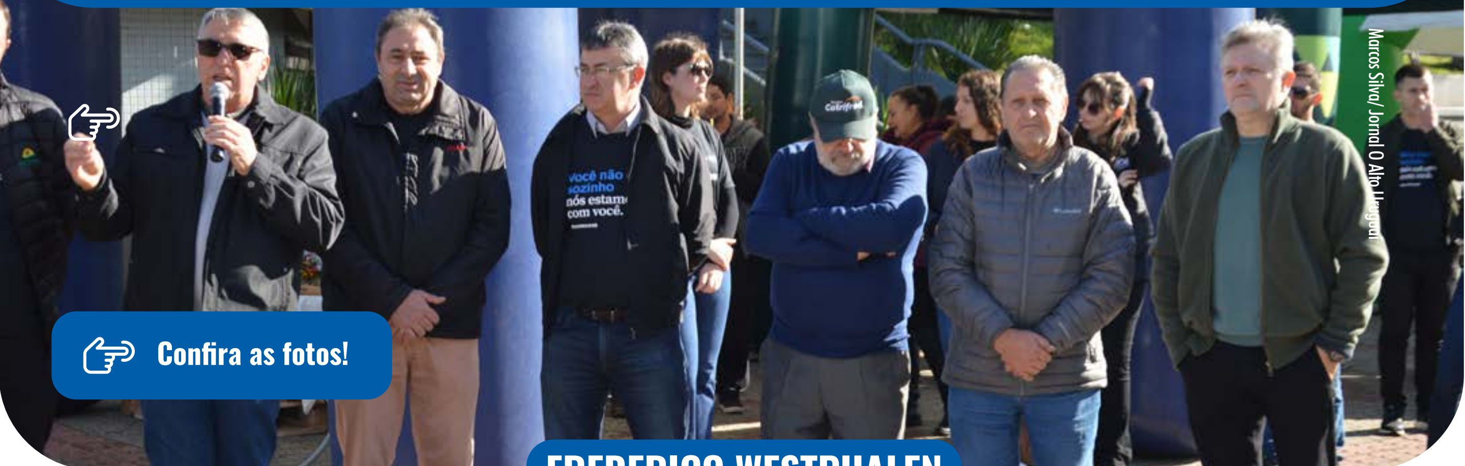
Marcos Silva / Jornal O Alto Uruguai