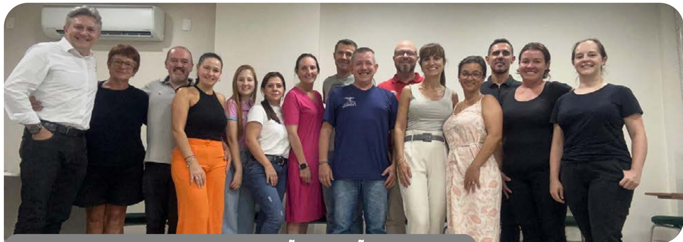
Acom / Magia da Patinação

Em breve, o Clube Magia dará início às atividades de 2025, com a abertura de novas matrículas. Informações sobre o clube e as vagas disponíveis podem ser obtidas pelo Instagram @magiapatinacao.