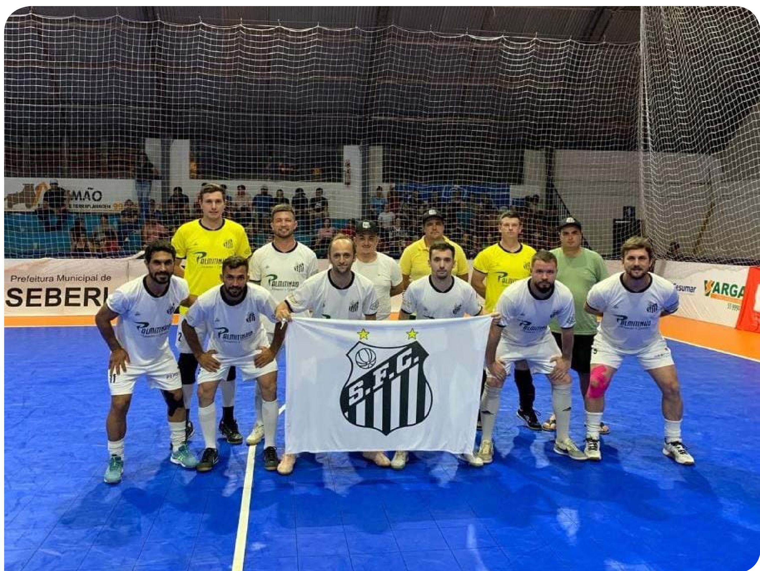
Assom - Campeonato Futsal/Divulgação

Os jogos de hoje, 9, vão ocorrer a partir das 19 horas, serão quatro partidas disputadas nas categorias prata, ouro e veteranos. Estão previstas mais de 75 rodadas para a primeira fase da competição. A terceira rodada ocorreu na noite de quarta-feira, 8, depois do fechamento desta edição digital.