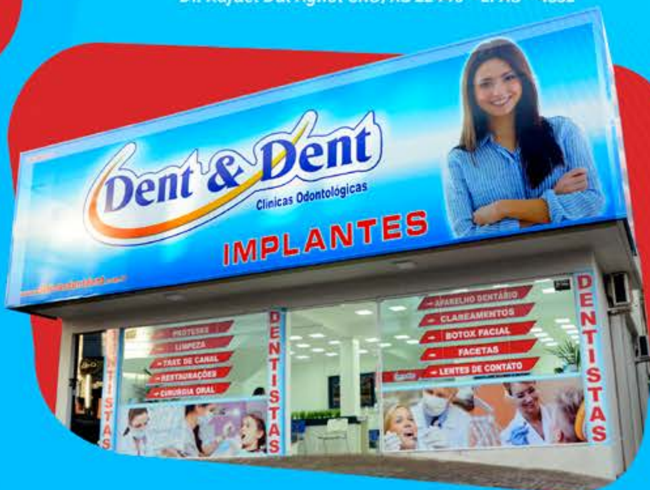
FAU ESTUÍO DE