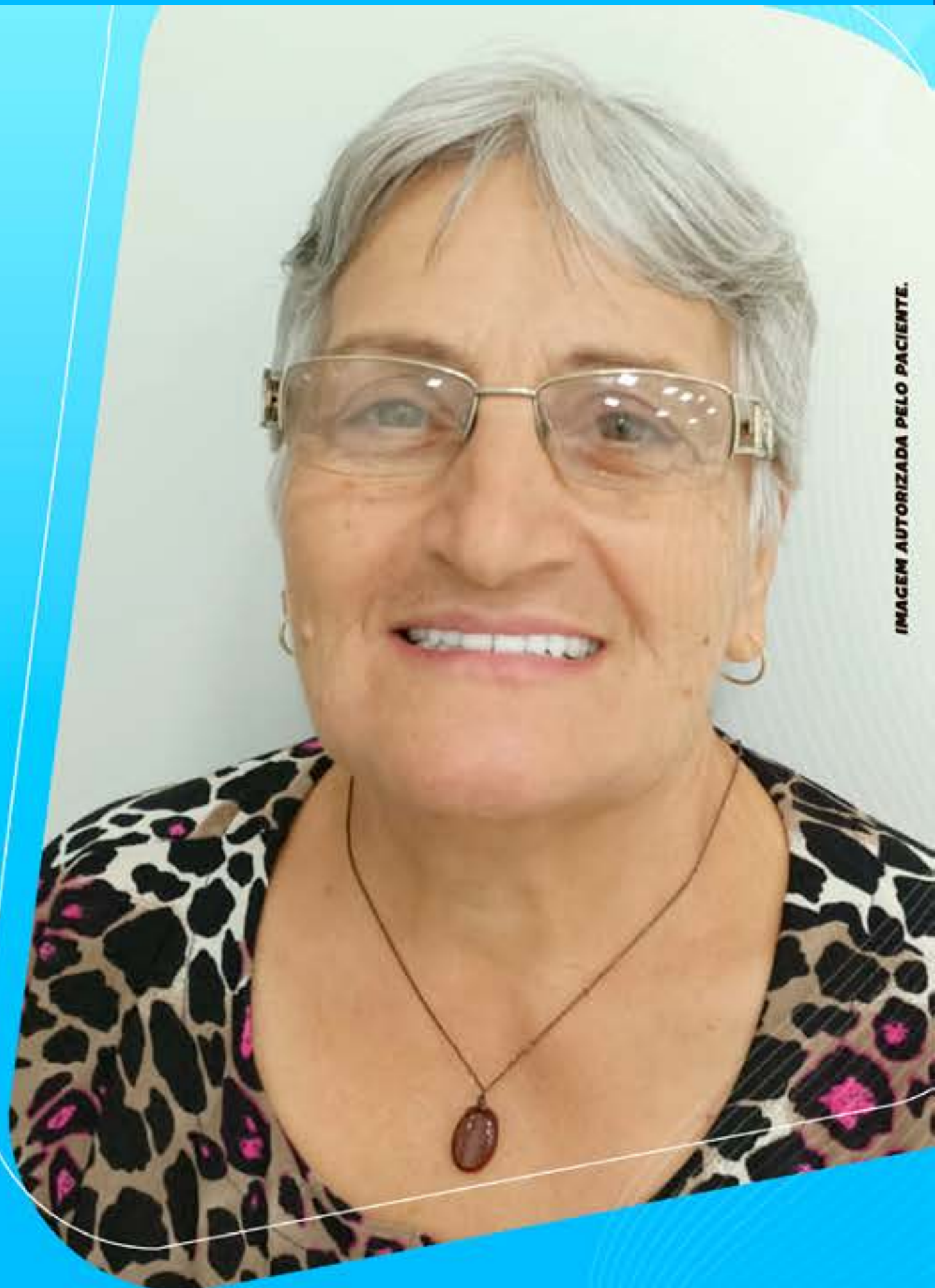
IMAGEM AUTORIZADA PELO PACIENTE.