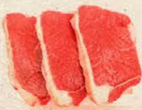
COXAO DE FORA BOVINO KG