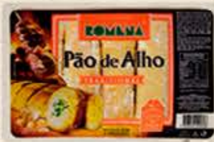
PÃO DE ALHO ROMENA 450G