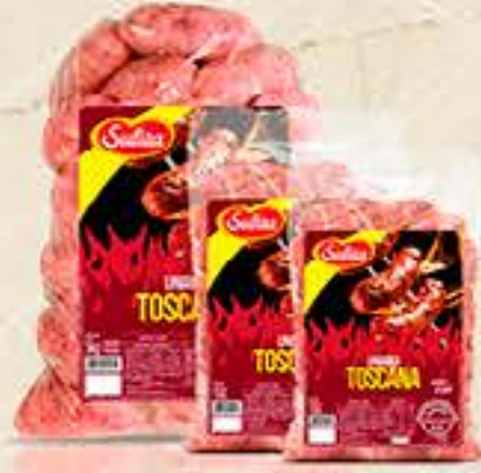
LINGUIÇA TOSCANA SULITA 600G