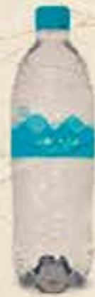
ÁGUA MINERAL VALLE AZUL 510ML