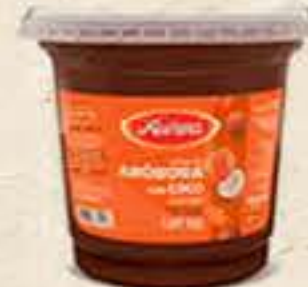
DOCE CREMOSO DE FRUTAS ÁUREA 350G