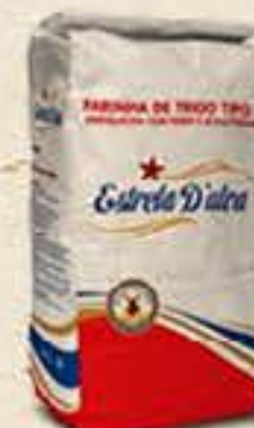
FARINHA DE TRIGO ESTRELA DALVA 5KG