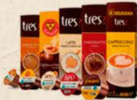
CAFÉ TRÊS CORAÇÕES CÁPSULA