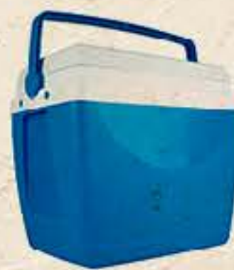
CAIXA TÉRMICA MOR 34 LITROS