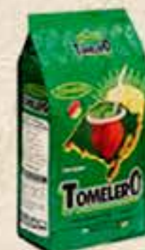
ERVA MATE TOMELERO 1KG