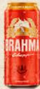
CERVEJA BRAHMA LATÃO 473ML