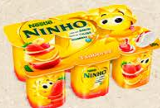
IOGURTE NESTLÉ NINHO SOL POLPA BANDEJA 540G