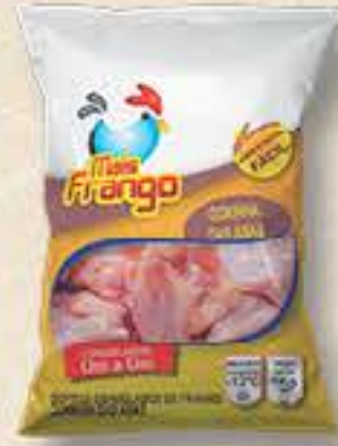
COXINHA ASA MAIS FRANGO / ABRE FÁCIL 1KG