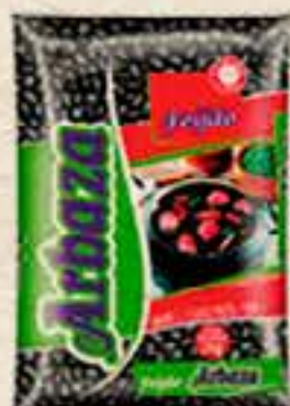
FEIJÃO PRETO ARBAZATI 1KG