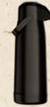
GARRAFATÉRMICA TERMOLAR MAGIC PUMP 1.8L