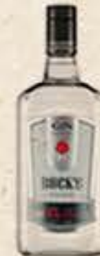
GIN ROCKS 1L