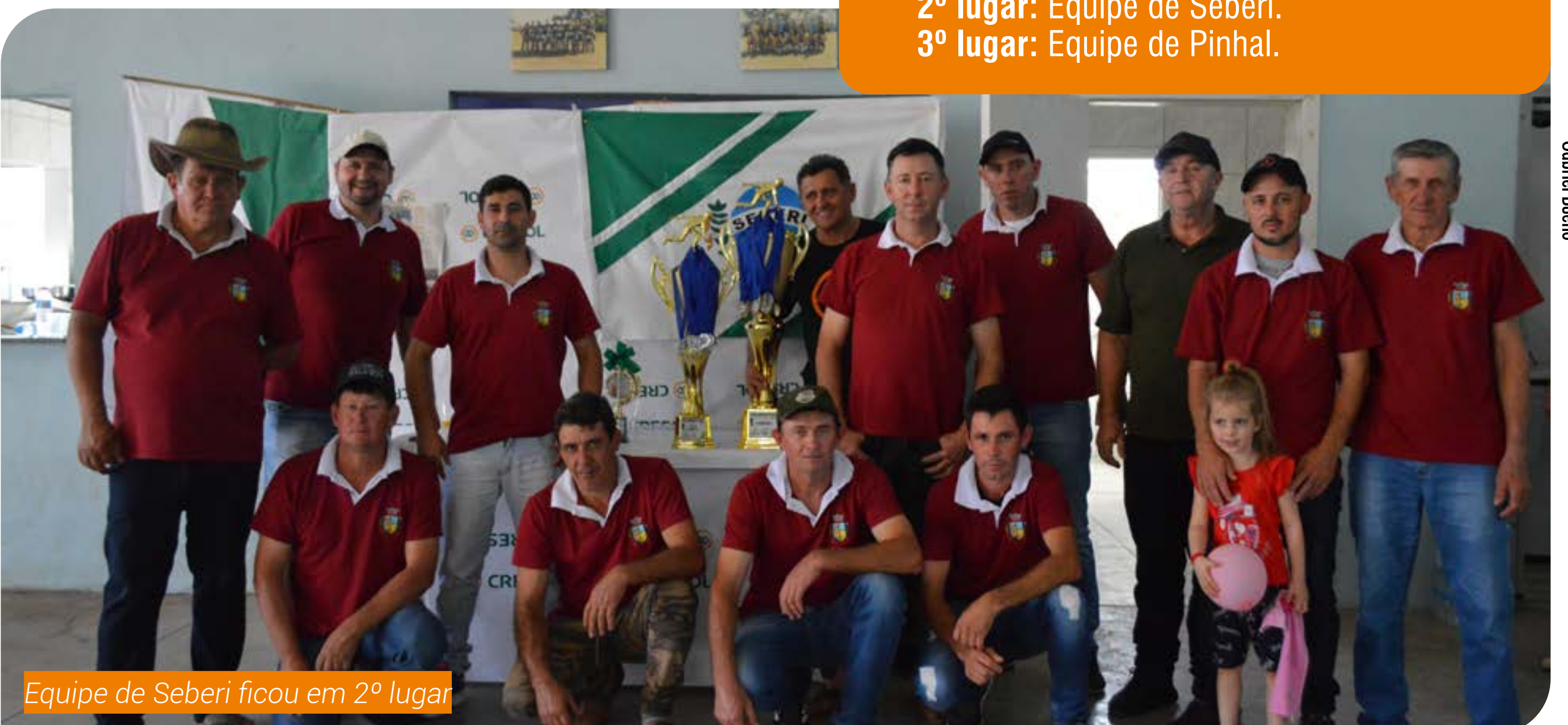
Equipe de Seberi ficou em 2º lugar