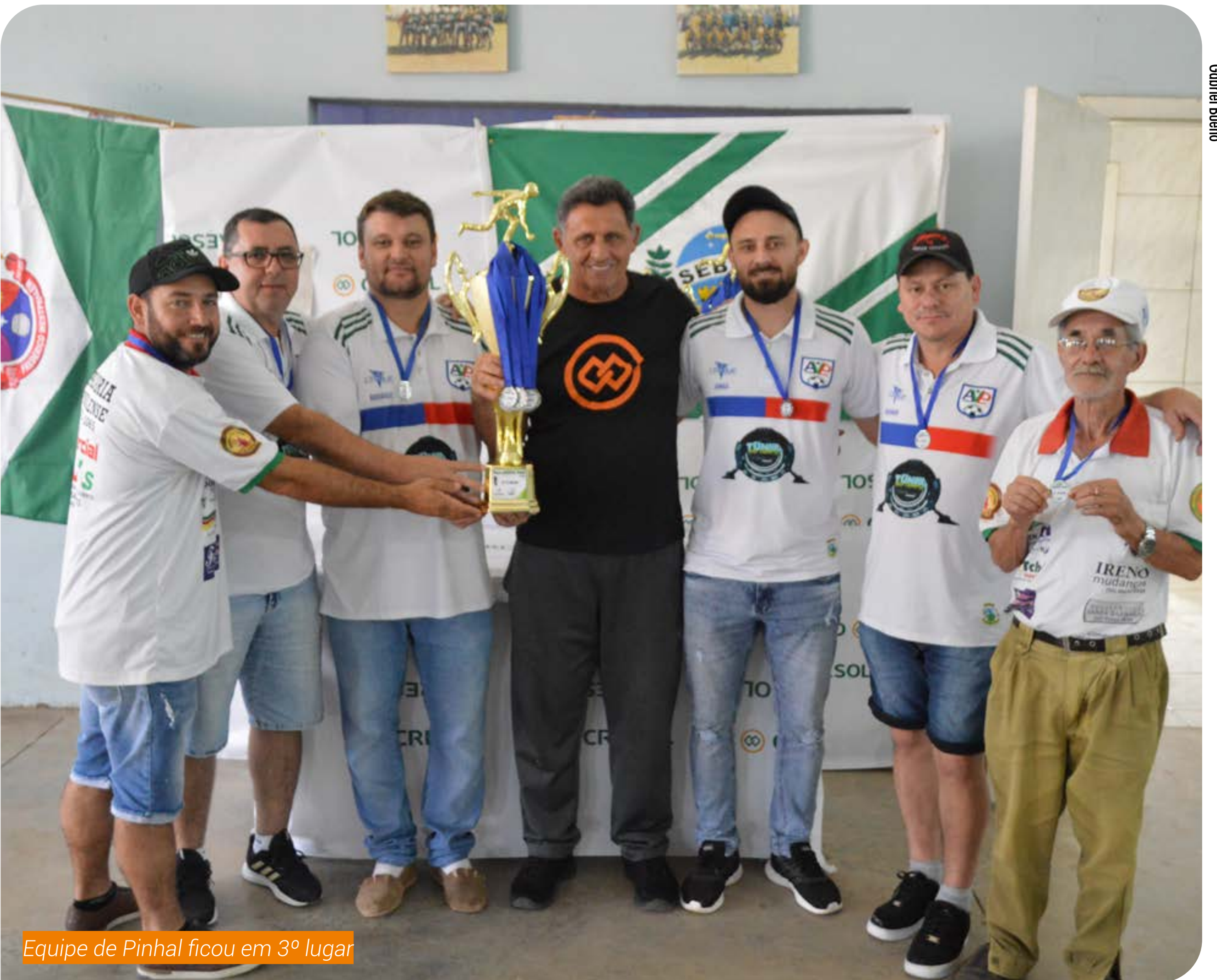
Equipe de Pinhal ficou em 3º lugar