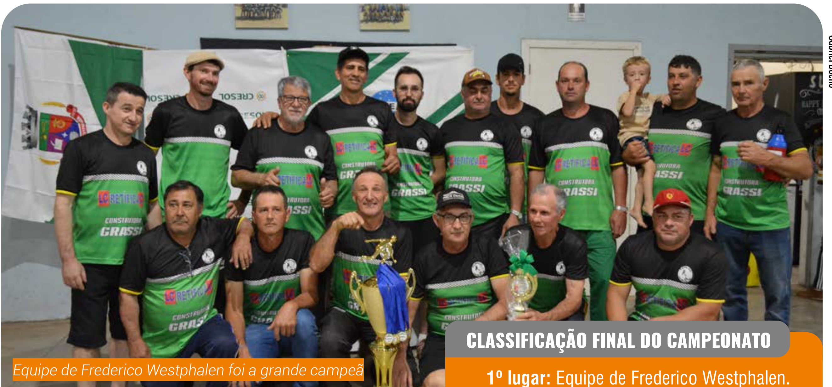
Equipe de Frederico Westphalen foi a grande campeã