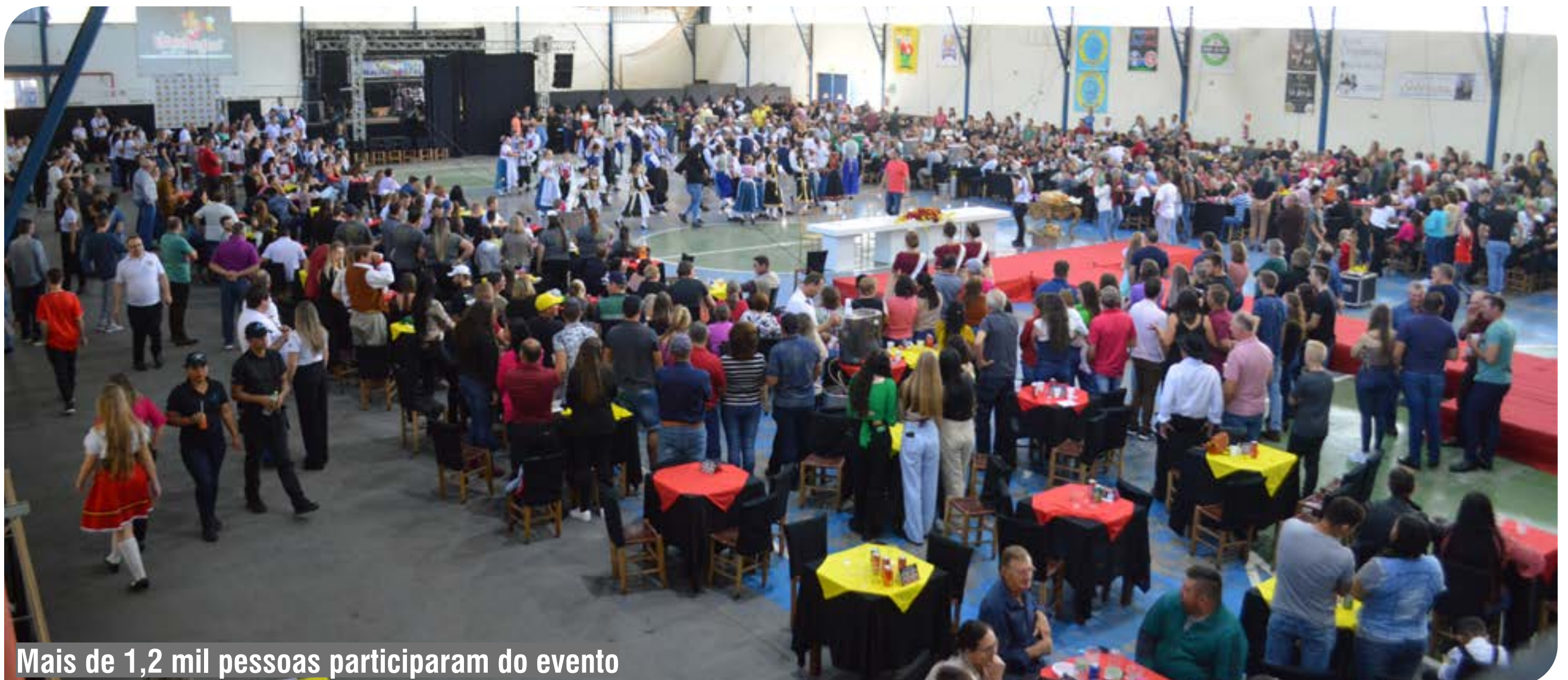
Mais de 1,2 mil pessoas participaram do evento