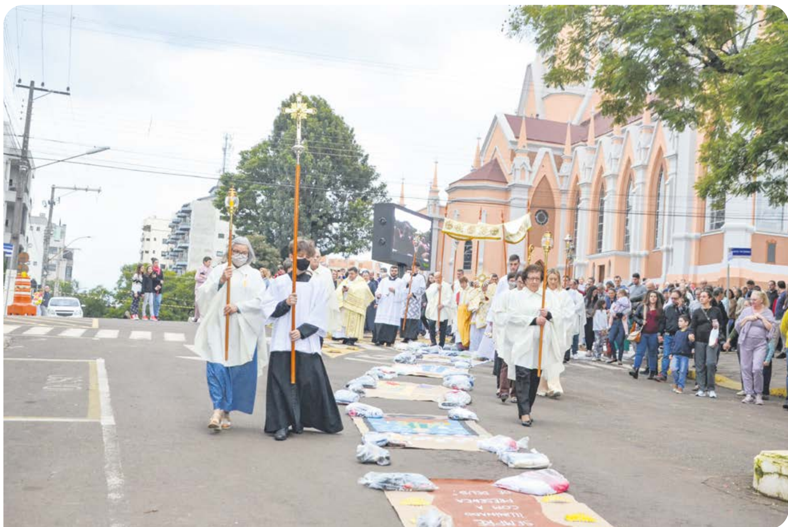
Dezenas de fiéis costumam participar da procissão de Corpus Christi em FW