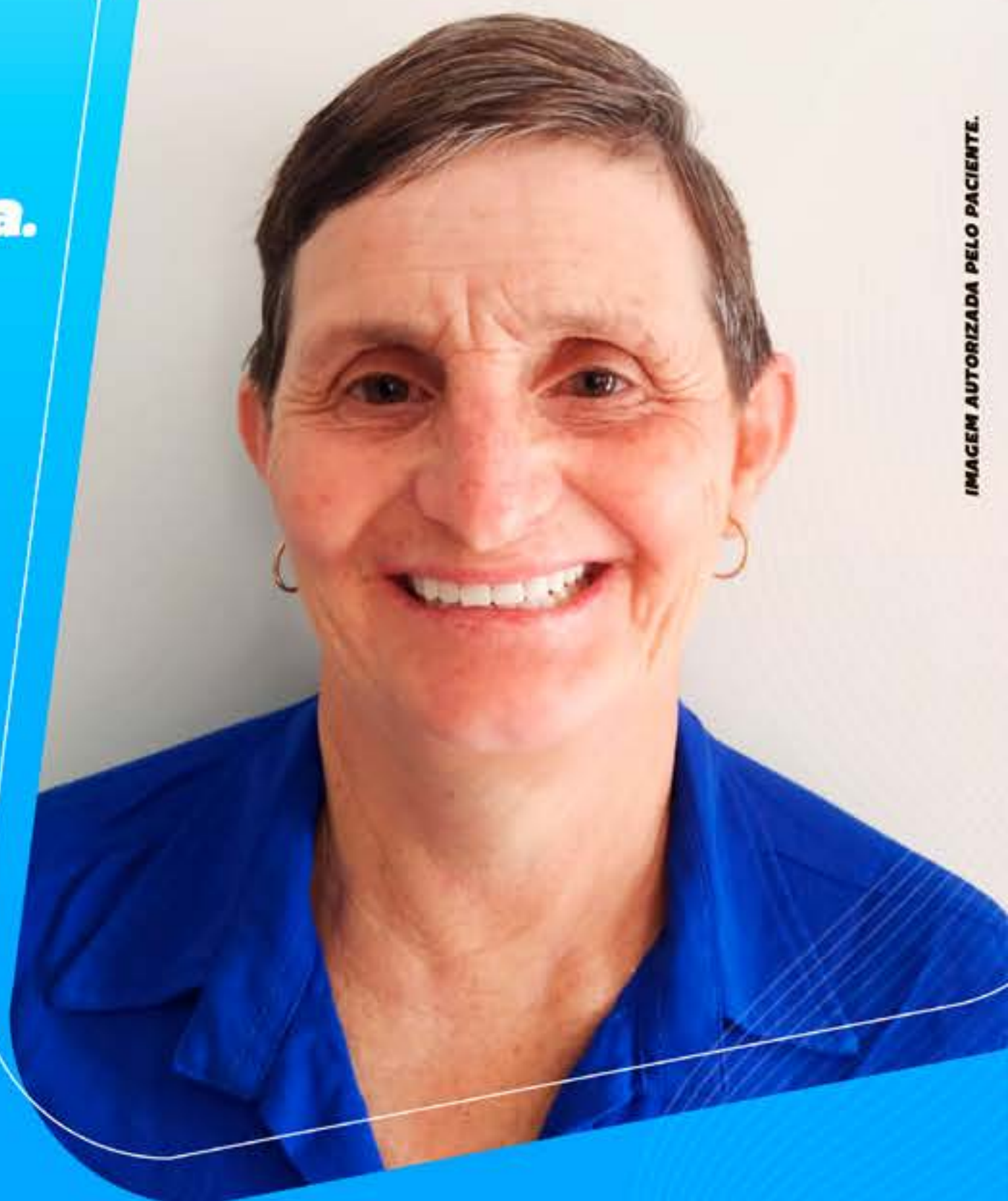
IMAGEM AUTORIZADA PELO PACIENTE.