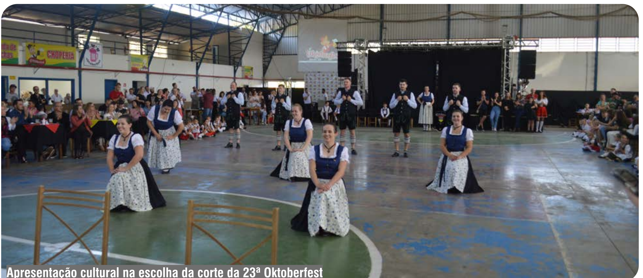
Apresentação cultural na escolha da corte da 23ª Oktoberfest