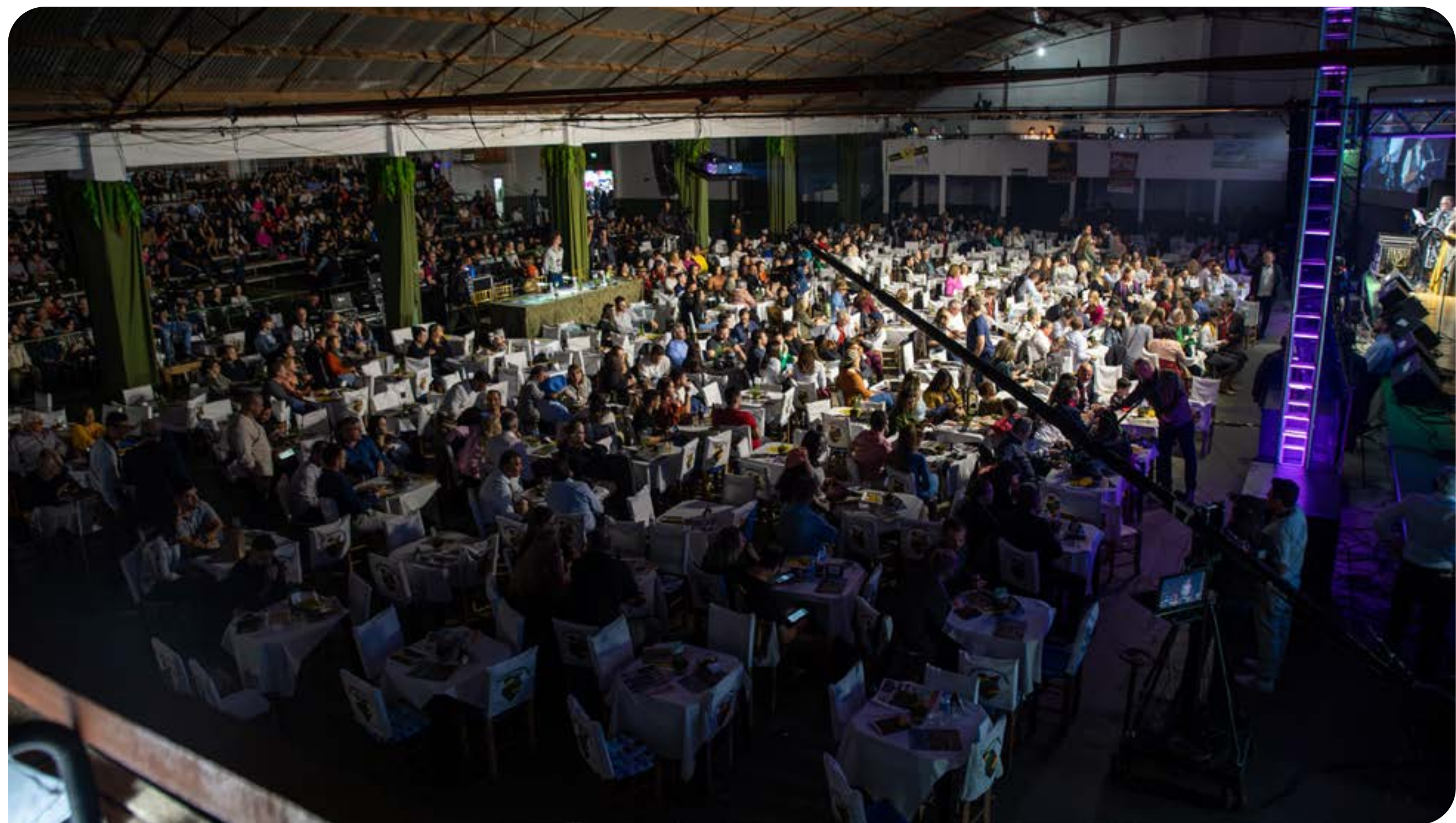
Festival Carijo Da Canção Gaúcha/Divulgação

Confira a matéria completa na próxima edição impressa do jornal AU!