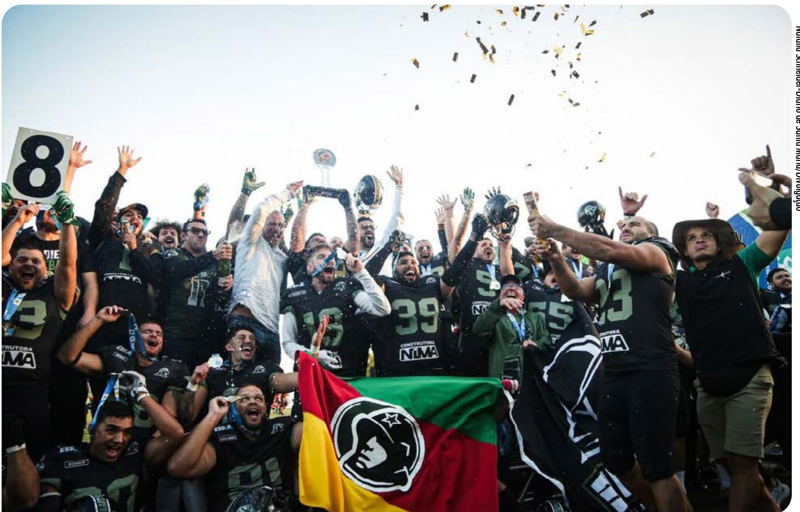
Notícia Schneider - Diário de Santa Maria/Divulgação

O Soldiers agora se prepara para a disputa da Liga Brasileira de Futebol Americano, que inicia em julho. A equipe disputa a Conferência Sul, com equipes de Santa Catarina e Paraná.