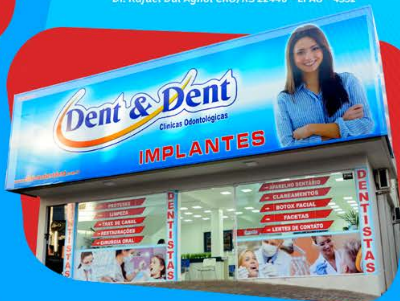
IMAGEM AUTORIZADA PELO PACIENTE