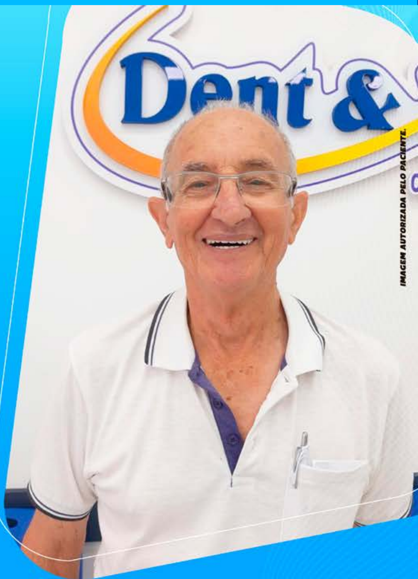
IMAGEM AUTORIZADA PELO PACIENTE