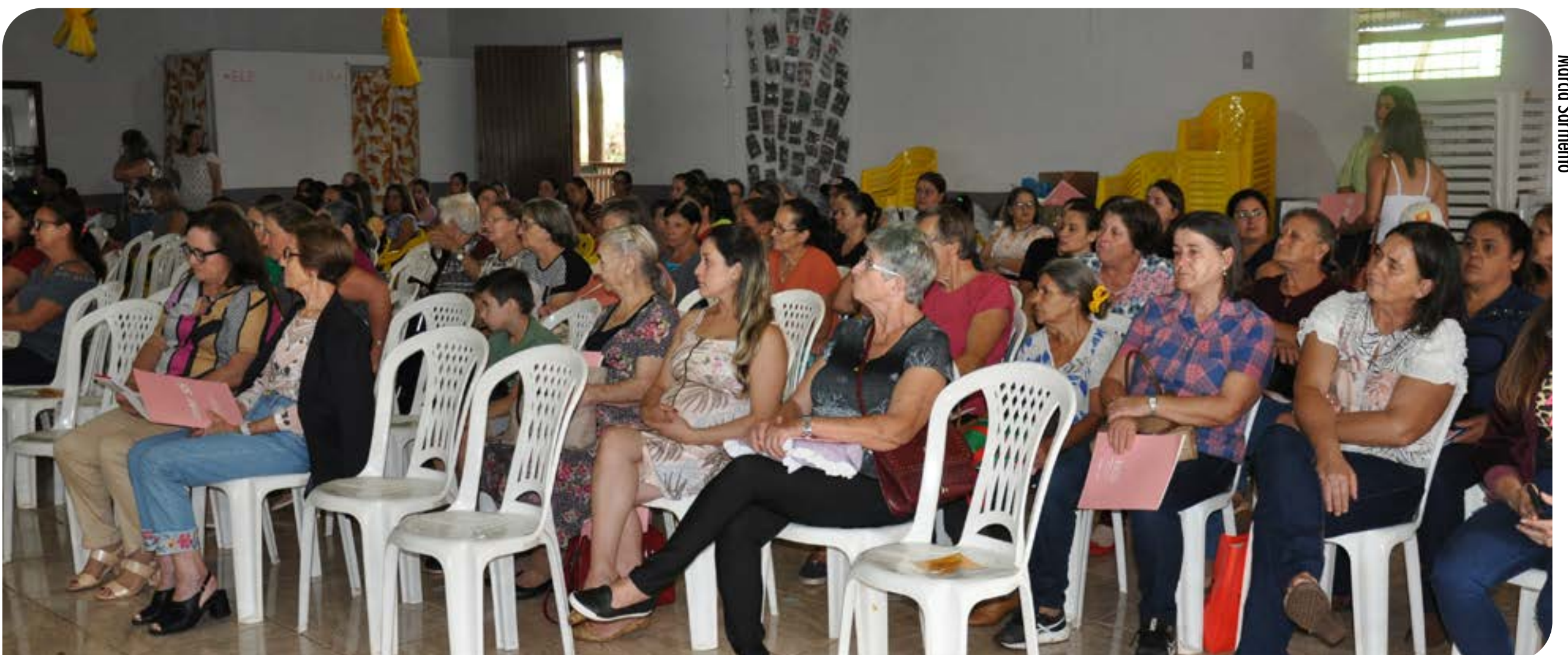
Público participou de várias atividades durante o dia