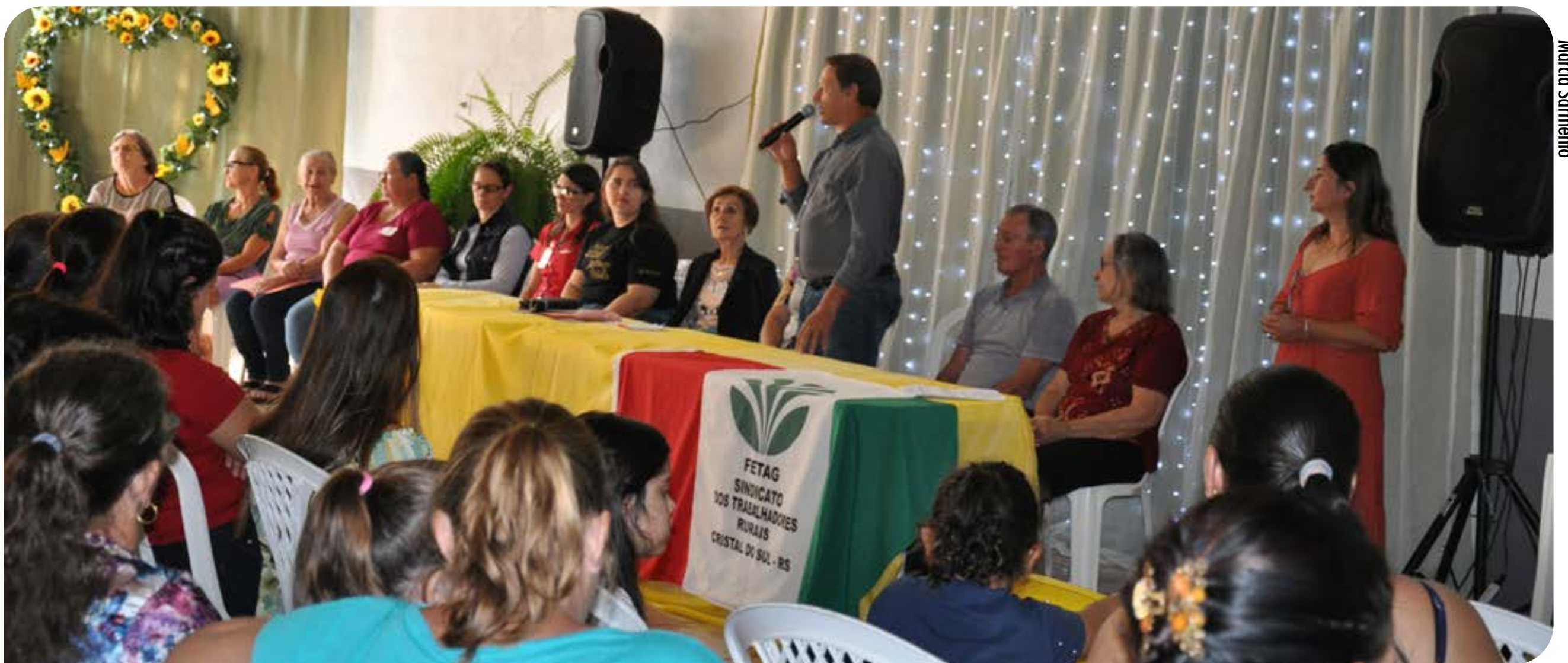
O 2º Encontro de Mulheres contou com a presença do prefeito de Cristal do Sul, Otelmo Reis

Confira a matéria completa na edição impressa do AU do próximo sábado, 11.