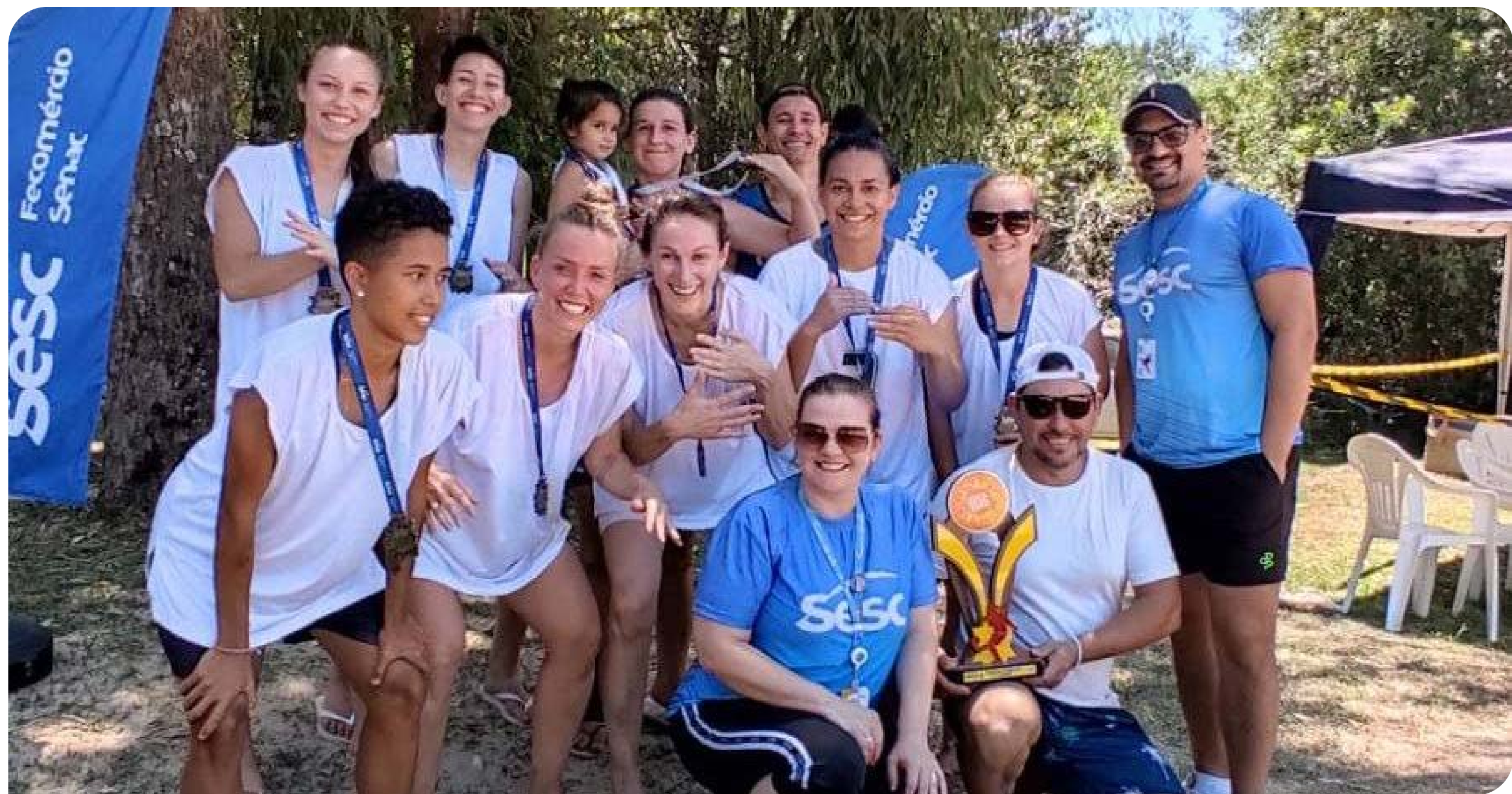
Pifa – Poolar Industrial garantiu vaga na final em Torres