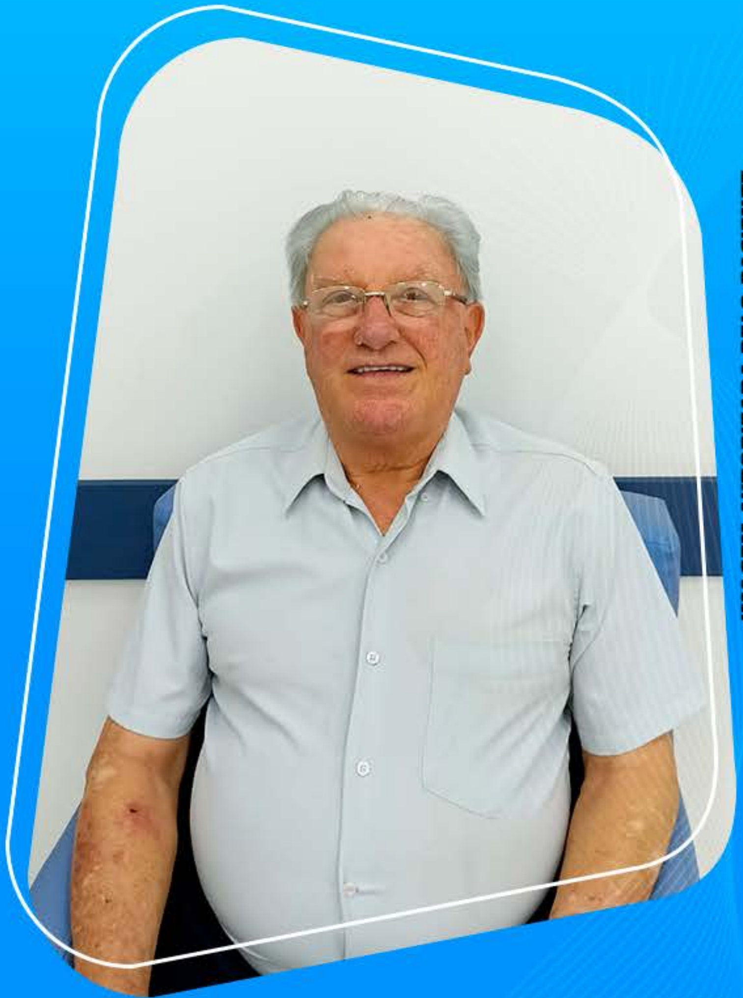
IMAGEM AUTORIZADA PELO PACIENTE.

FAÇA COMO ELE VENHA FAZER UMA AVALIAÇÃO 📞 55 9.8474-2020