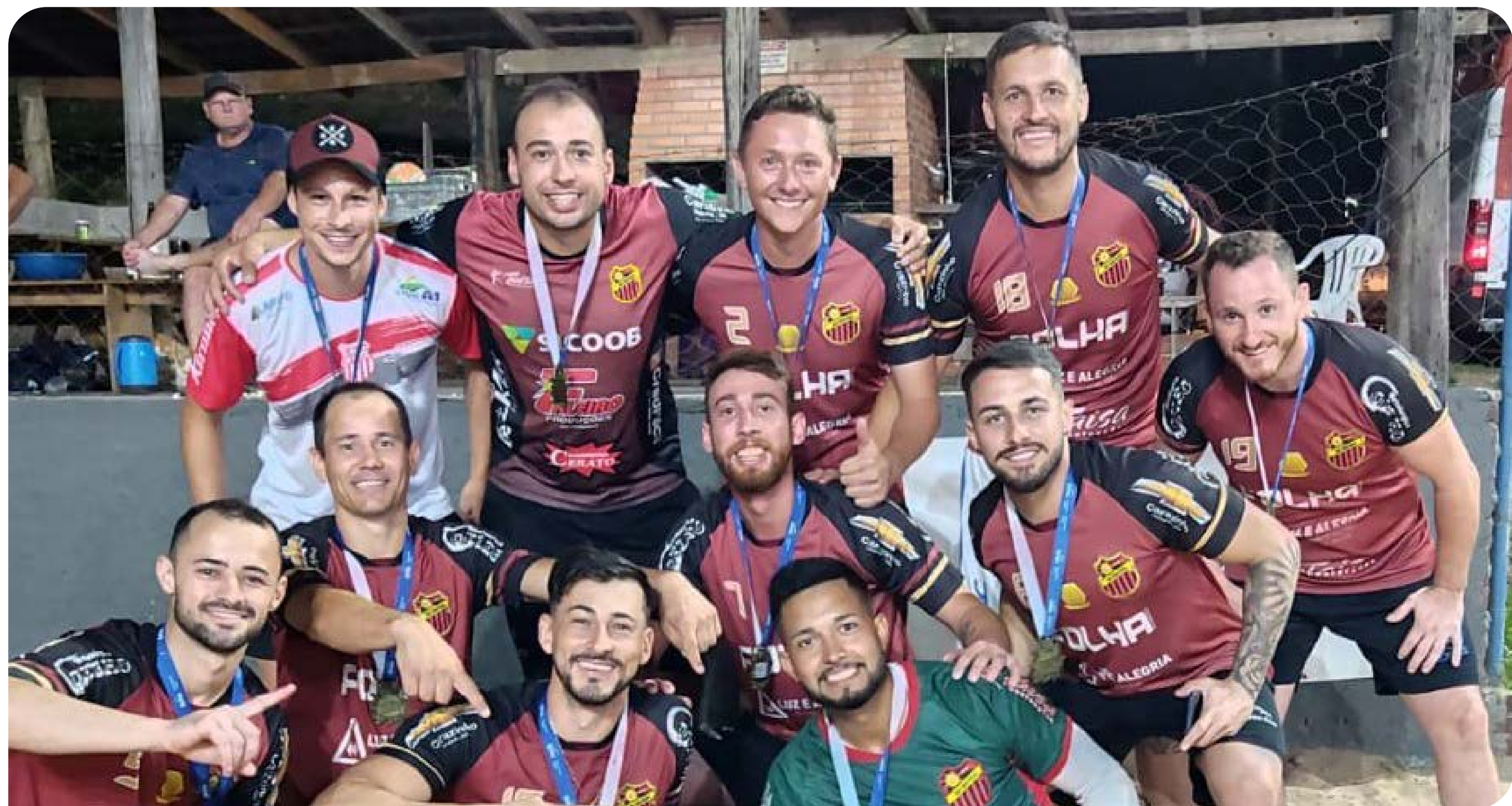
Equipe Chupim Eletrodomésticos/Albarelo Terraplanagem venceu etapa de futebol de areia de FW