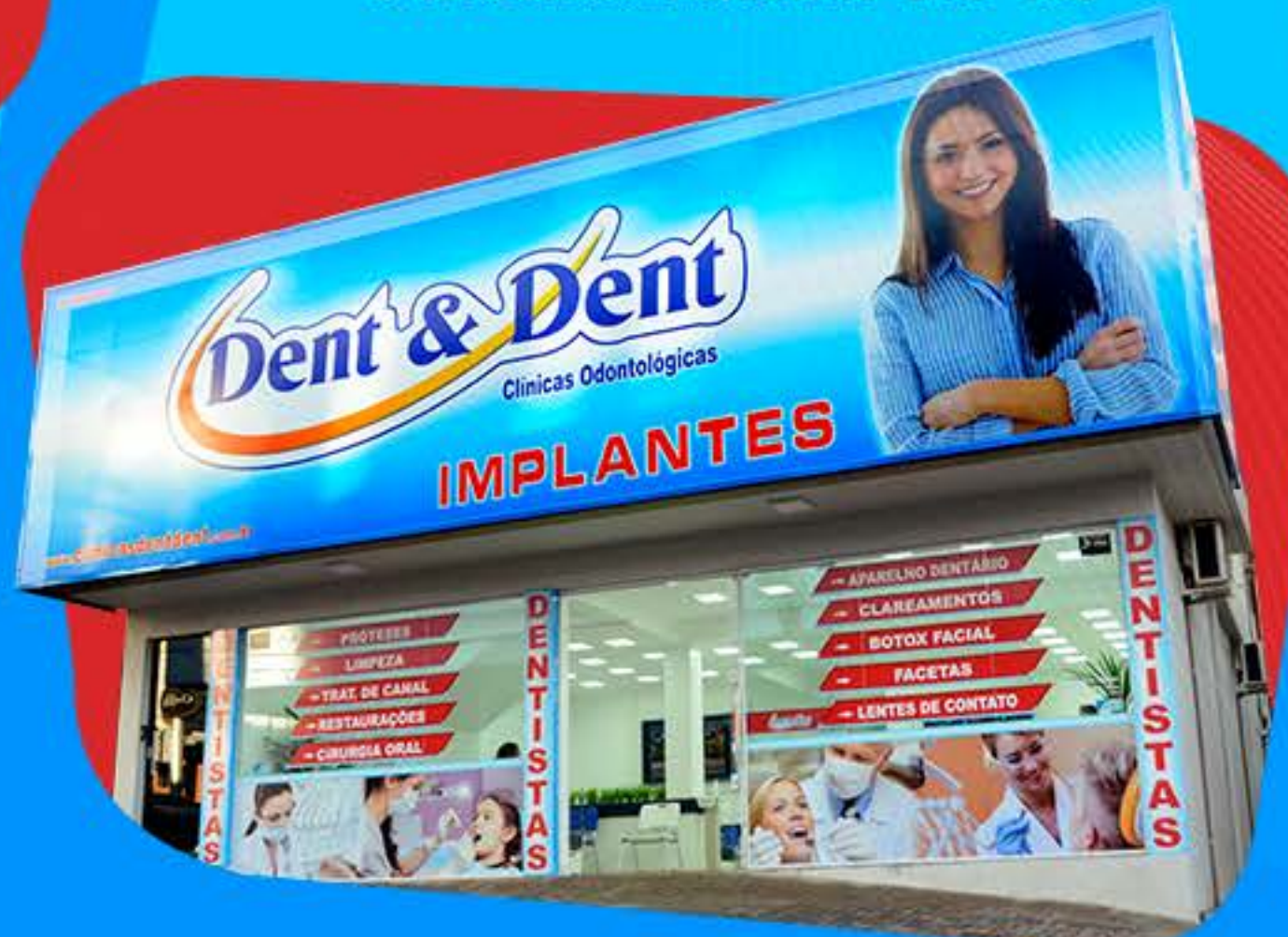
IMAGEM AUTORIZADA PELO PACIENTE.