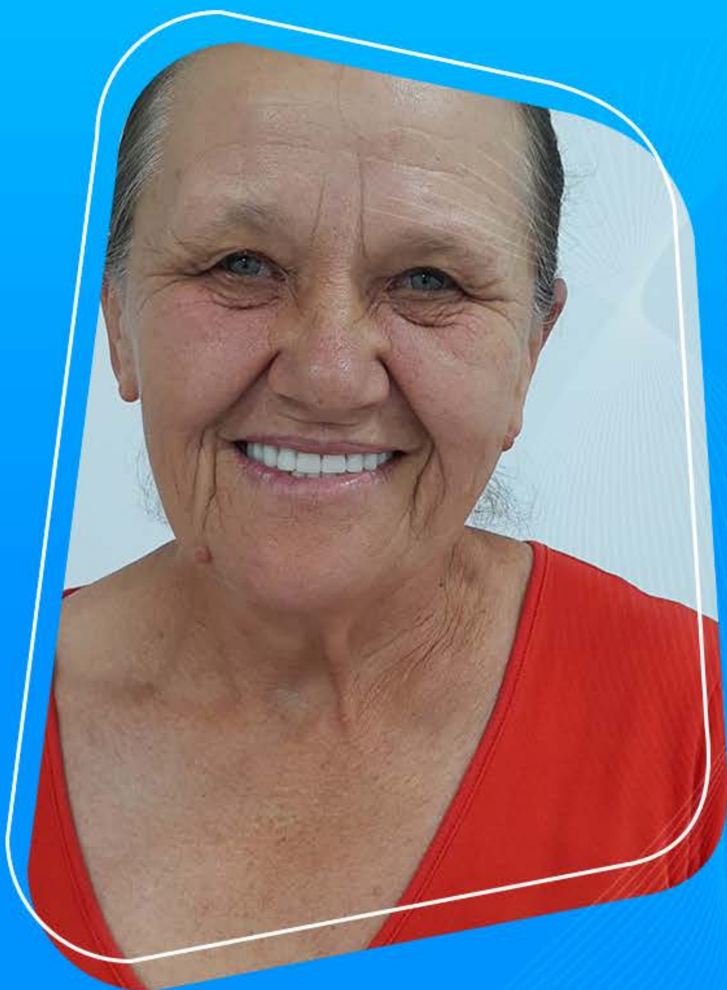
IMAGEM AUTORIZADA PELO PACIENTE.