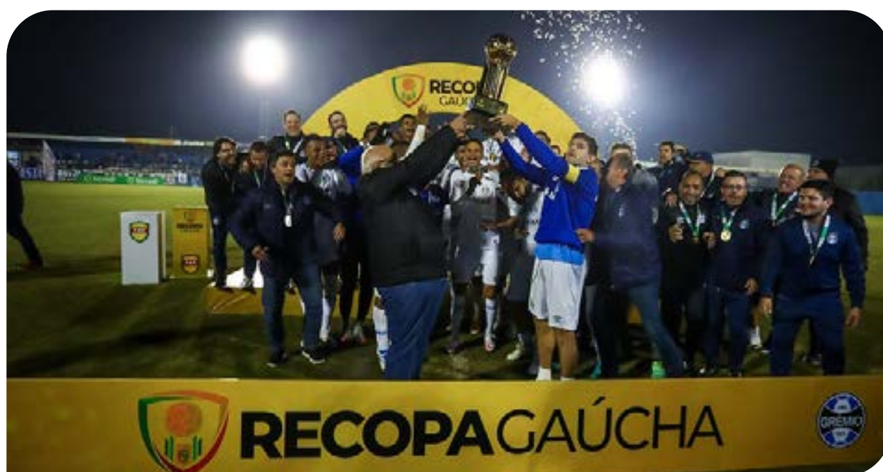
Grêmio é o atual vencedor da Recopa Gaúcha e pode se tornar tetracampeão do certame