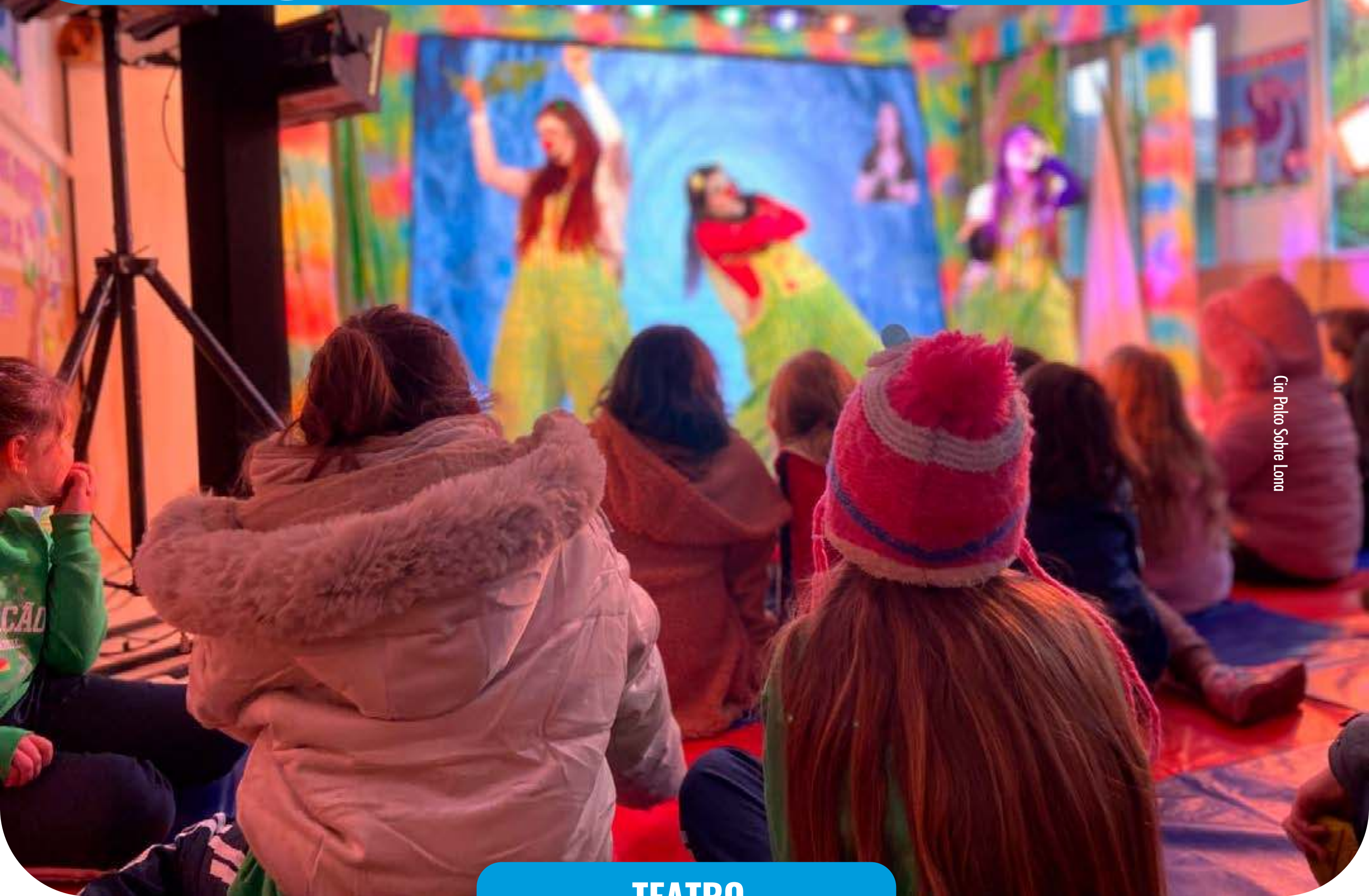
Cia Palco Sobre Lona