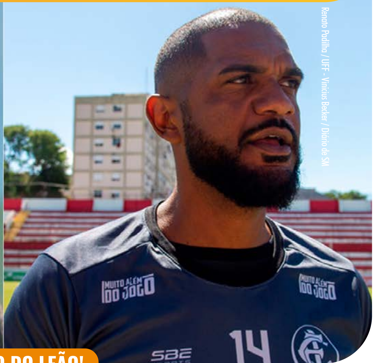
Renato Padilha / UFF - Vinícius Becker / Diário de SM