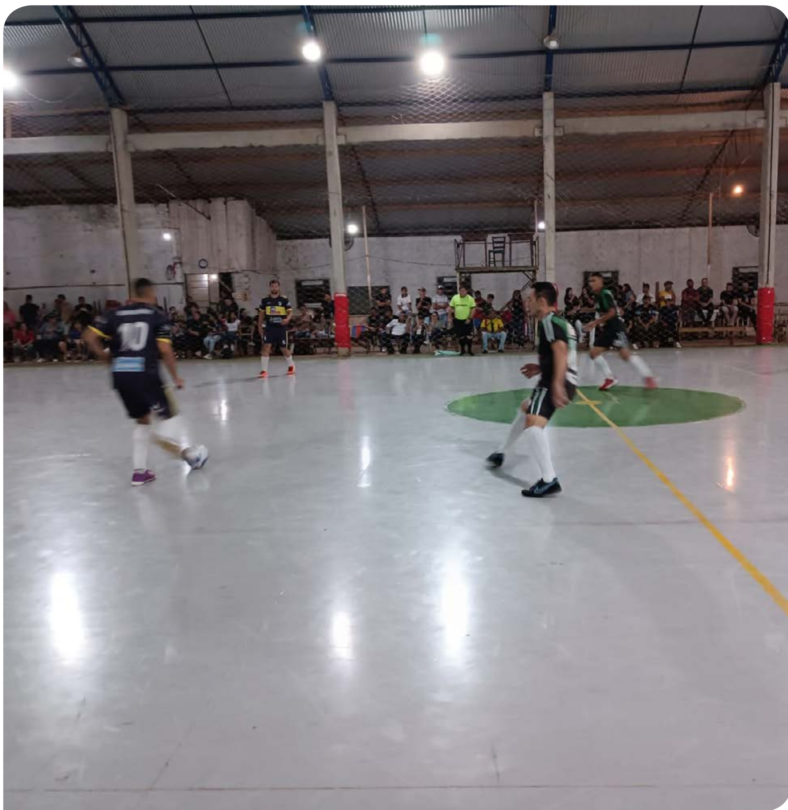
Arquivo jornal AU

livre); Arco Iris/ Neblina x Figueirense FC (feminino); e Arsenal x Toca e Sai (livre). A última rodada ocorreu na última sexta-feira, 10 com três jogos.