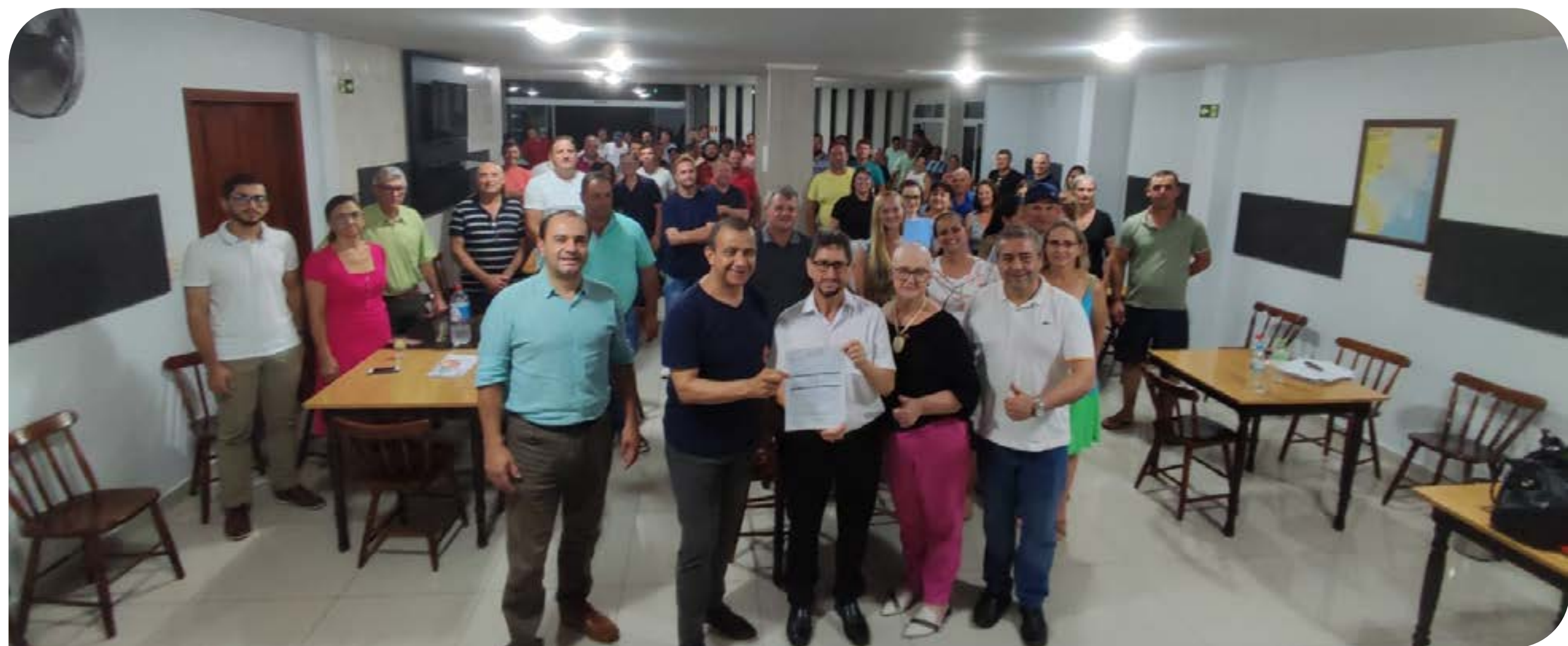
Elevado Stucke-Assom Rodeio Bonito

O prefeito agradeceu a acolhida dos deputados e salientou a parceria de longa data já existente e que já rendeu bons frutos para a comunidade rodeiense e regional.