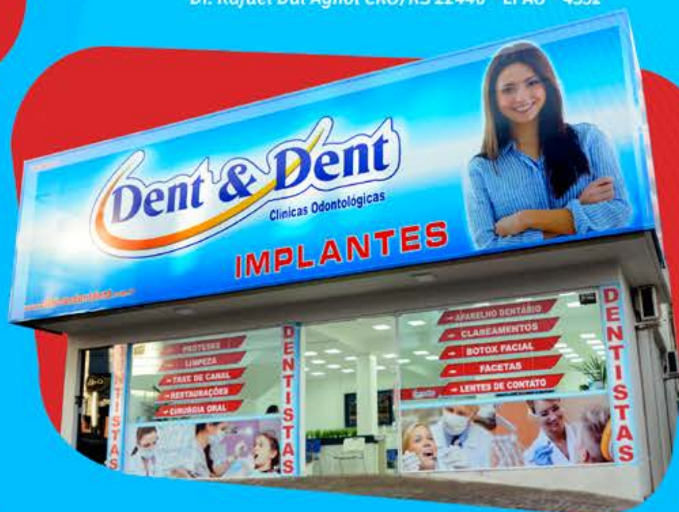
FAU ESTUÍO DE