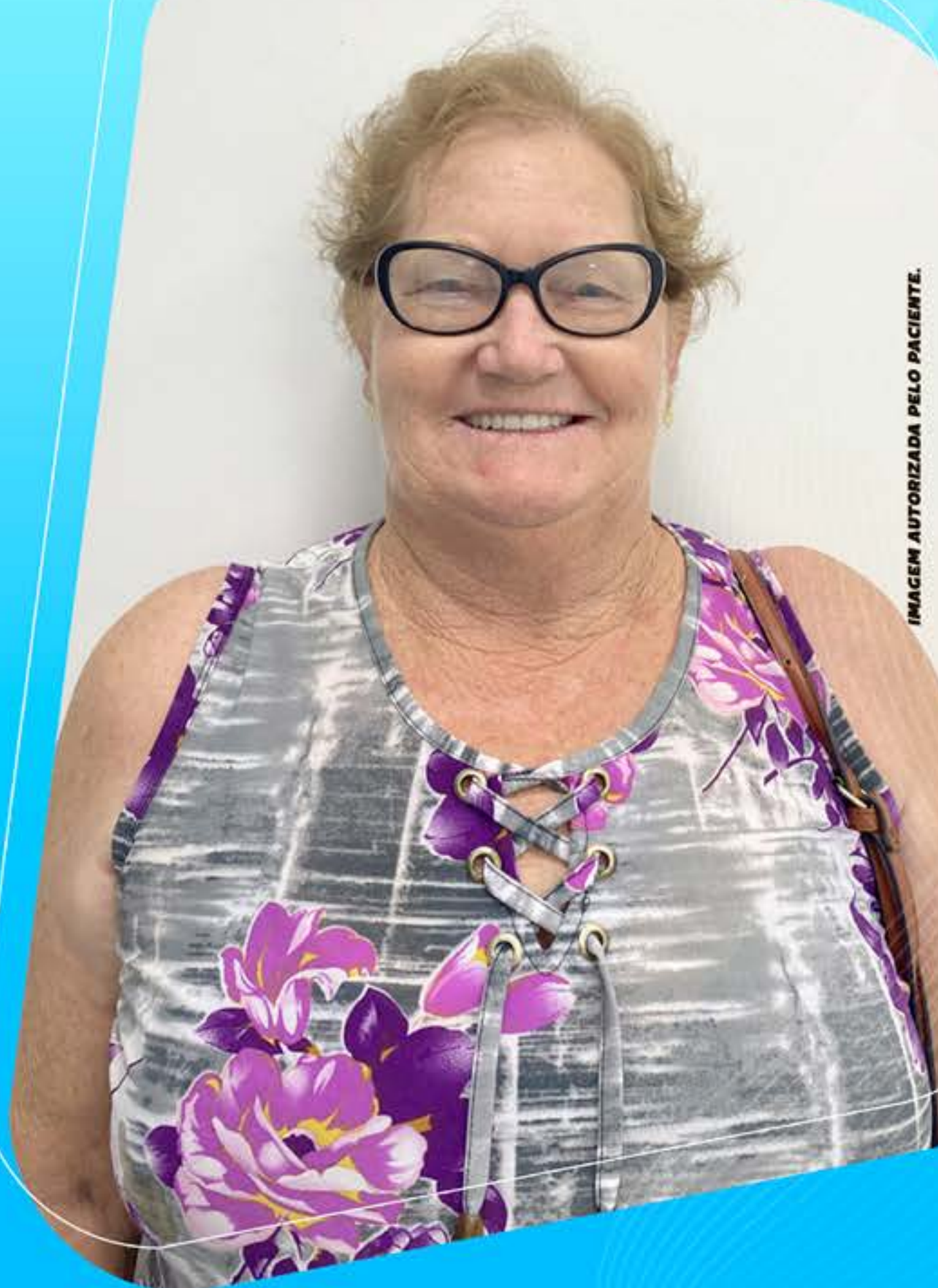
IMAGEM AUTORIZADA PELO PACIENTE.