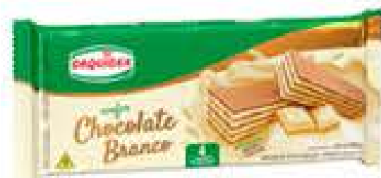
WAFFER ORQUÍDEA 100G R$ 1,98