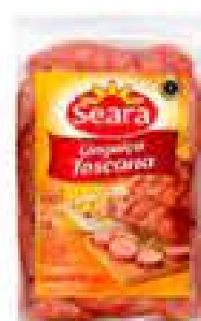
LINGUIÇA TOSCANA SEARA 700G R$ 12,98