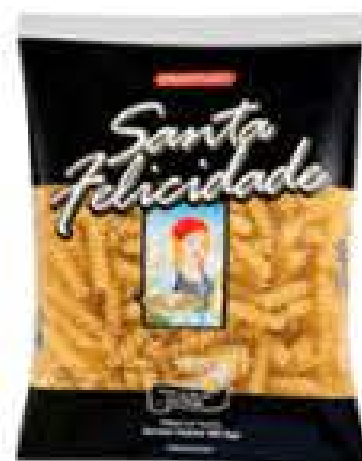
MASSA SANTA FELICIDADE C/OVOS 500G R$ 2,99