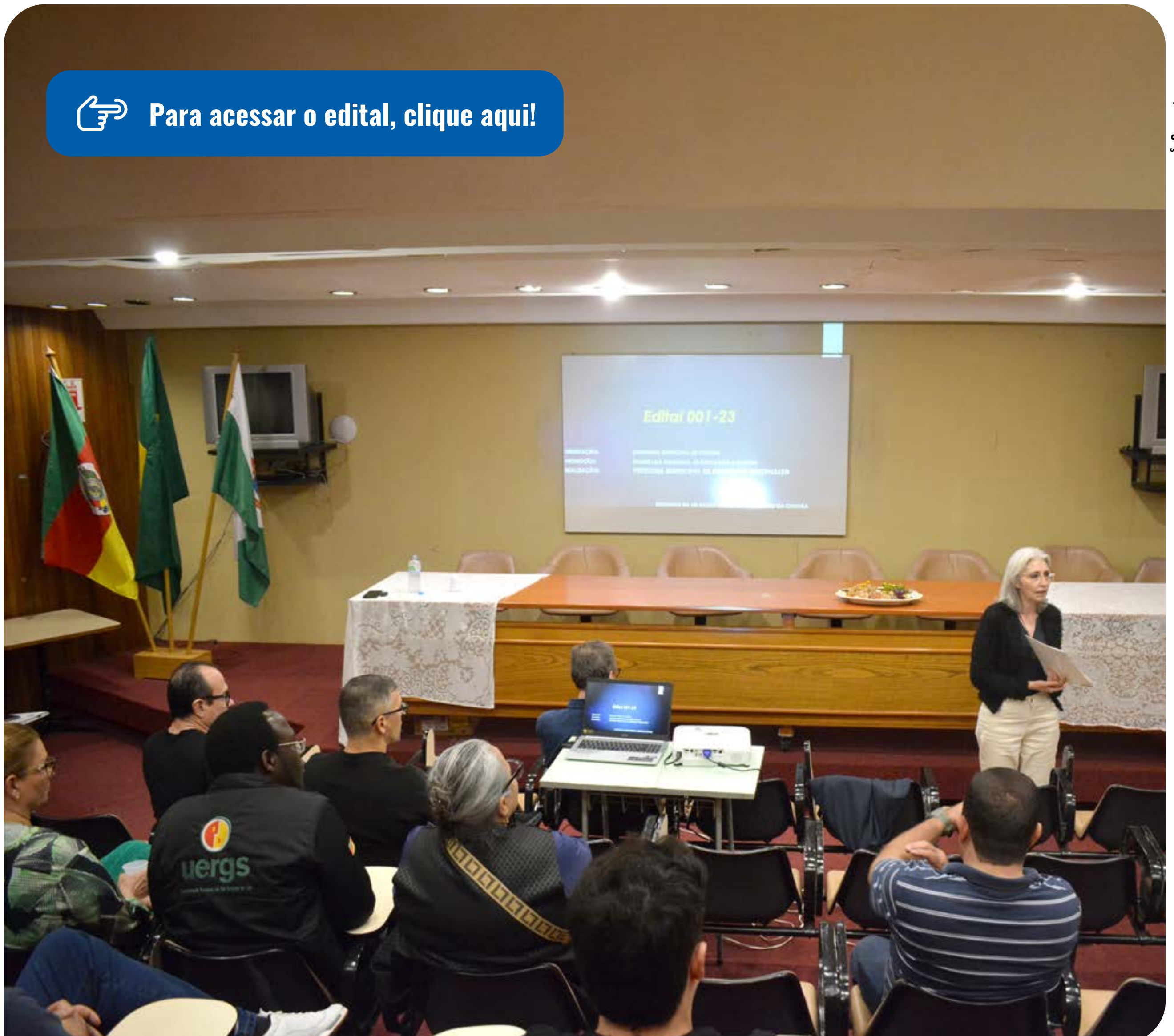
Lançamento do edital aconteceu na noite de terça-feira, 3