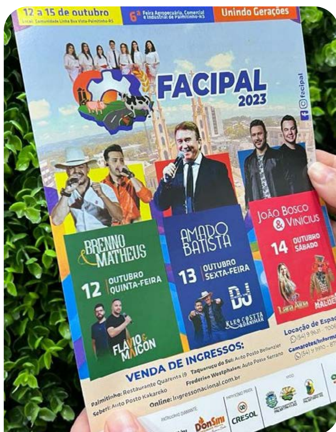
Jornal O Alto Uruguai