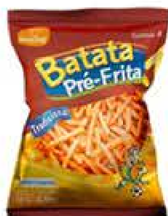
BATATA PALITO EASY CHEF TRAD 2KG R$ 26,98