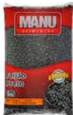
FEIJÃO PRETO MANU T1 1KG R$ 5,75