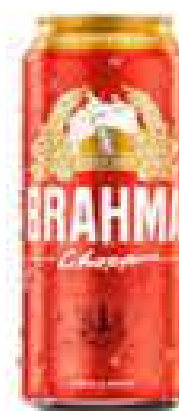
CERVEJA BRAHMA CHOPP LATÃO 473ML R$ 3,99