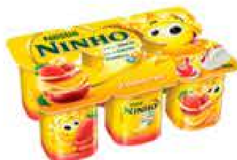
IOGURTE NESTLÉ NINHO SOL POLPA 540G/6UND R$ 6,98