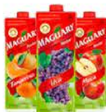
SUCO MAGUARY 1L R$ 4,68