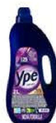
AMACIANTE YPE 2L R$ 6,98