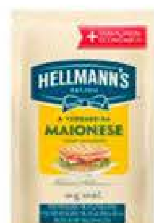
MAIONESE HELLMANN'S 400G SACHÊ R$ 6,98