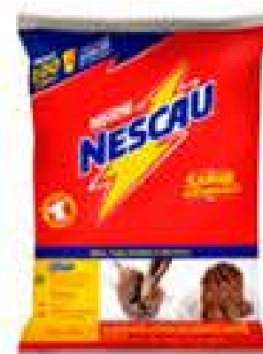
ACHOCOLATADO NESCAU 2KG SACHÊ R$ 29,98