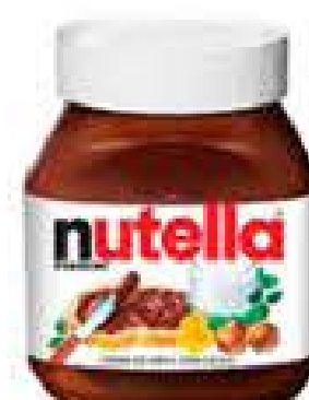
NUTELLA 350G R$ 21,98

IMAGENS MERAMENTE ILUSTRATIVAS - OFERTAS VÁLIDAS ATÉ 07/10/2023