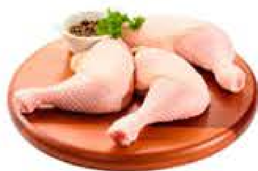
COXA COM SOBRECOXA DE FRANGO KG R$ 7,89