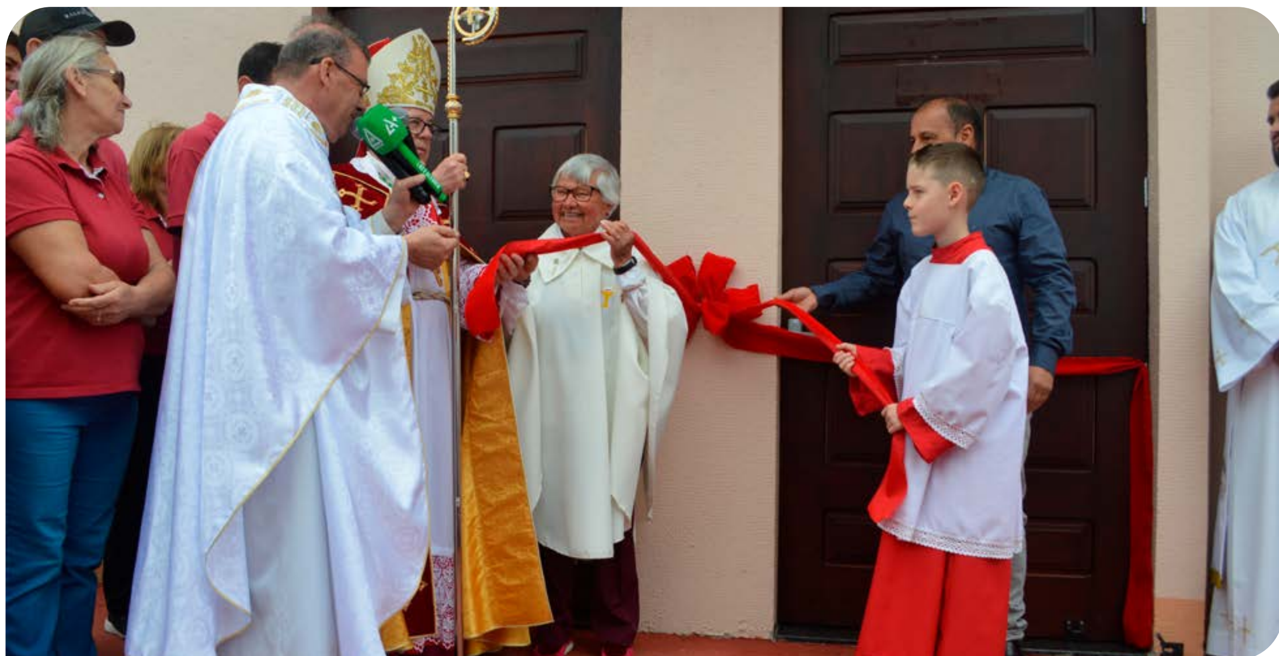
Thaone Otero/jornal O Alto Uruguai

Mais informações você confere na edição impressa do AU!