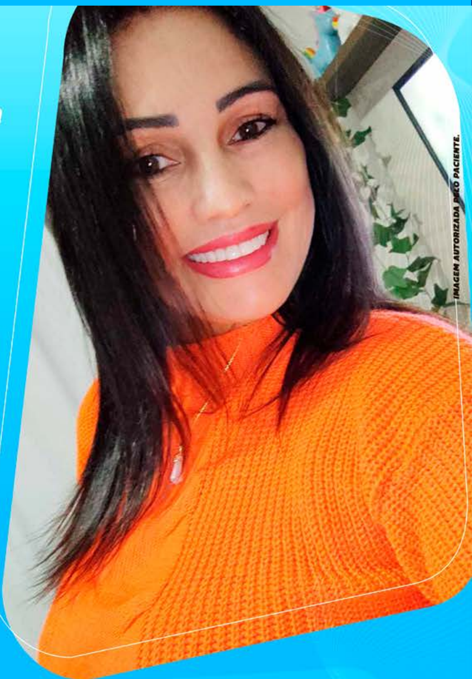
IMAGEM AUTORIZADA PELO PACIENTE.