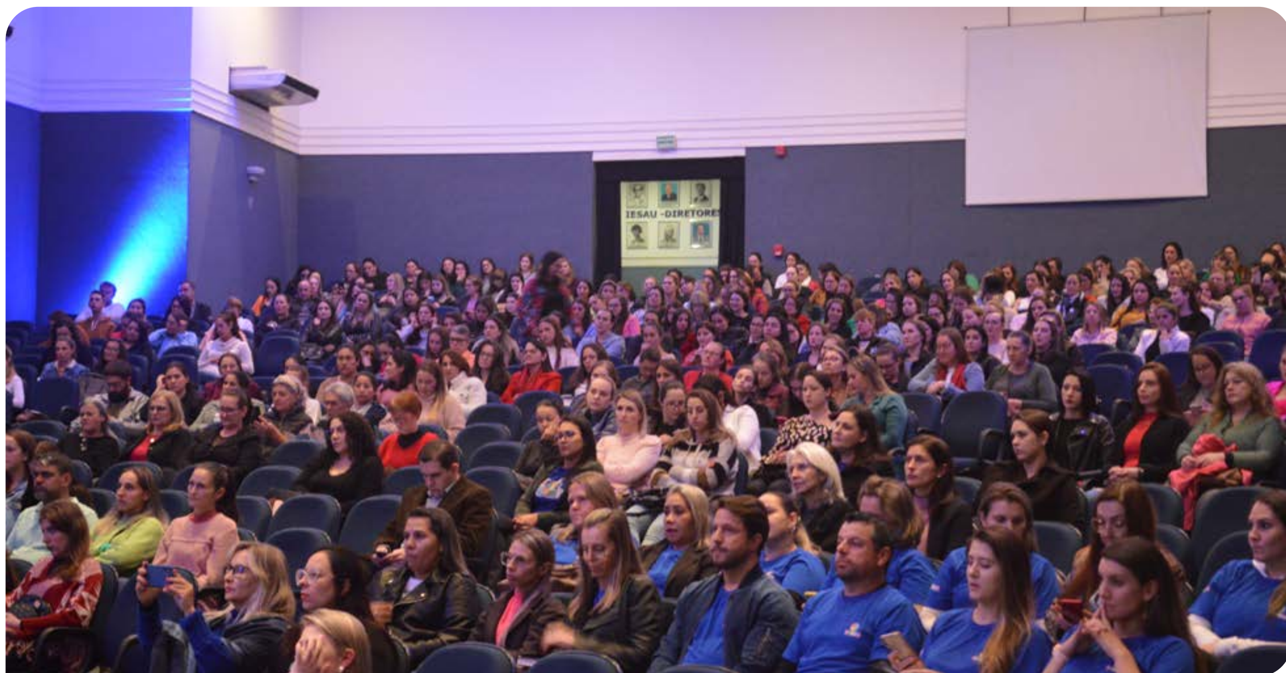
Evento ocorreu no salão de atos da URI/FW e contou com a presença de lideranças