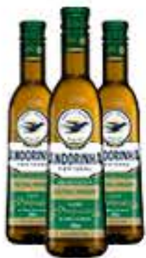
AZEITE OLIVA ANDORINHA 500ML R$ 24,95