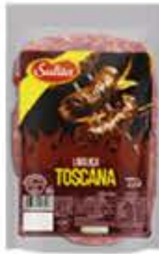
LINGUIÇA TOSCANA SULITA 600G R$ 10,98