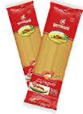
MASSA GERMANI C/ OVOS 500G R$ 3,45