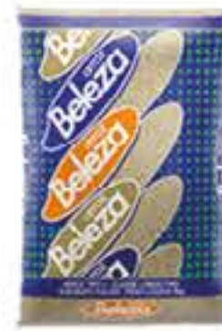
ARROZ BELEZA TP2 5KG R$ 15,75