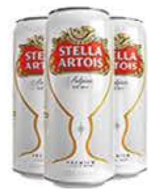
CERVEJA STELLA ARTOIS 473ML LATÃO R$ 4,85