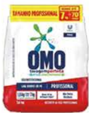
SABÃO EM PÓ OMO 5.6KG LAVAGEM PERF SACHE NESTA PROMOÇÃO 1KG SAI POR R$ 12,49 R$ 69,98