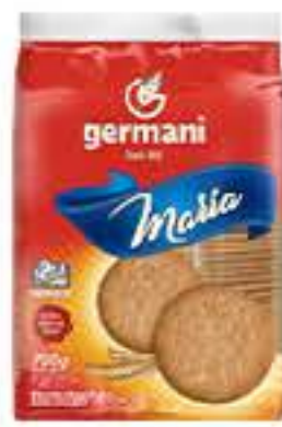
BISCOITO GERMANI MARIA 700G R$ 7,98