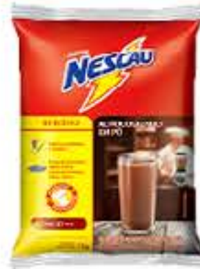
ACHOCOLATADO NESCAU 2KG SACHE NESTA PROMOÇÃO 3/06 SAI POR R$ 5,18 R$ 29,98