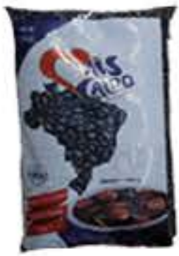
FEIJÃO PRETO MAIS CALDO 1KG R$ 5,85