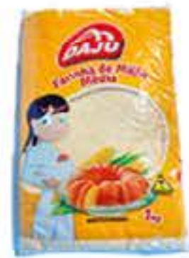
FARINHA DE MILHO DAJU 1KG R$ 3,38