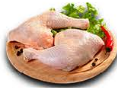
COXA COM SOBRECOXA DE FRANGO KG R$ 6,98