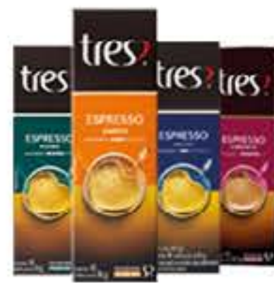
CAFÉ TRÊS CORAÇÕES CAPSULA 80G R$ 16,98