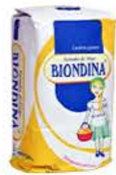
FARINHA TRIGO BIONDINA 5KG R$ 16,45