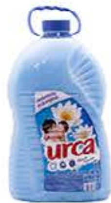
AMACIANTE URCA 5L R$ 12,75