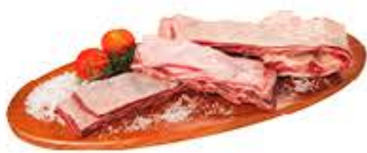
COSTELA DE 1ª BOVINA KG R$ 29,98