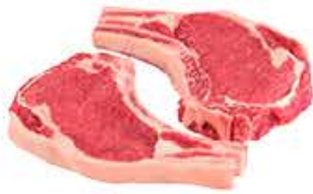
FILÉ COM OSSO BOVINO KG R$ 31,98