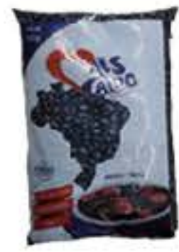
FEIJÃO PRETO MAIS CALDO 1KG