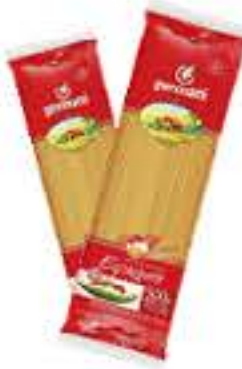
MASSA GERMANI C/ OVOS 500G