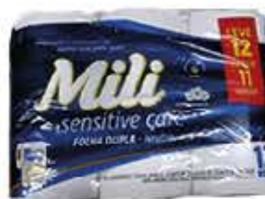
PAPEL HIGIÊNICO MILI FOLHA DUPLA 30M LEVE 12 PAGUE 11