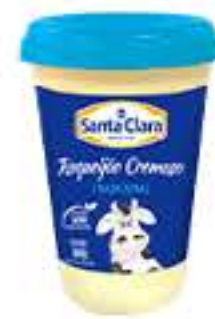
REQUEIJÃO SANTA CLARA 180G