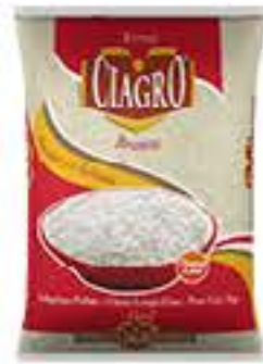
ARROZ CIAGRO TP1 5KG