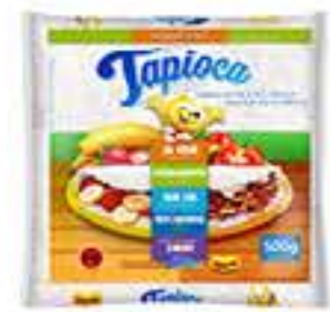
TAPIOCA ZAEI 500G