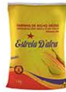
FARINHA DE MILHO ESTRELA D'ALVA 1KG