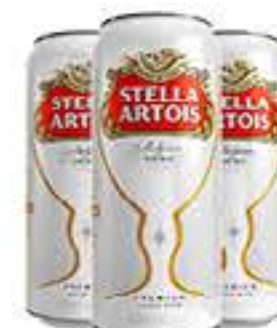
CERVEJA STELLAARTOIS 473ML LATÃO