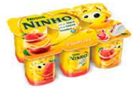
IOGURTE NESTLE NINHO SOL POLPA 540G/6UN BANDEJA