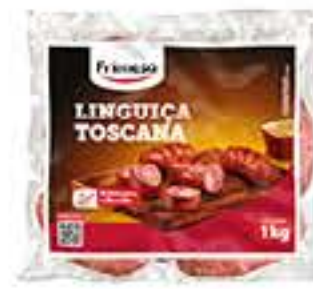
LINGUIÇA TOSCANA FRIMESA 1KG PACOTE