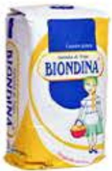
FARINHA TRIGO BIONDINA 5KG