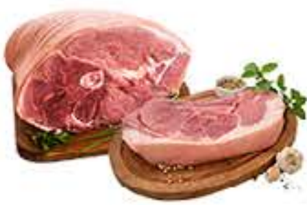
PERNIL E PALETA SUINA C/ PELE KG