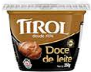
DOCE LEITE TIROL 350G