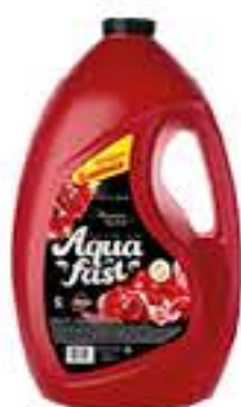
AMACIANTE AQUAFAST 5L