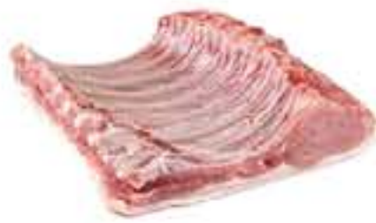
COSTELA SUINA COM CARRÉ MINGA C/ PELE KG