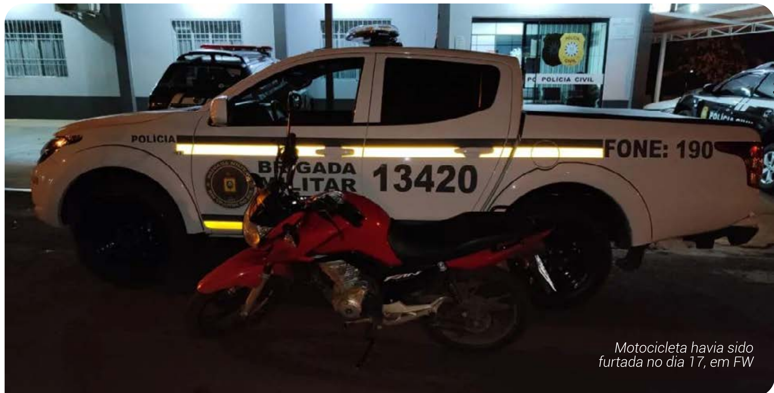
Motocicleta havia sido furtada no dia 17, em FW

A motocicleta foi localizada em via pública, um homem de 37 anos foi conduzido até a Delegacia de Polícia, pois estava na posse do veículo.