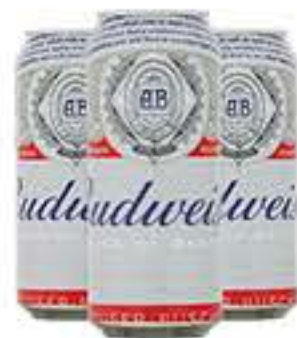
CERVEJA BUDWEISER 473ML LATÃO R$ 4,29