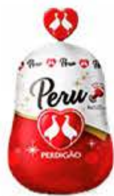
PERU PERDIGÃO KG R$ 29,98