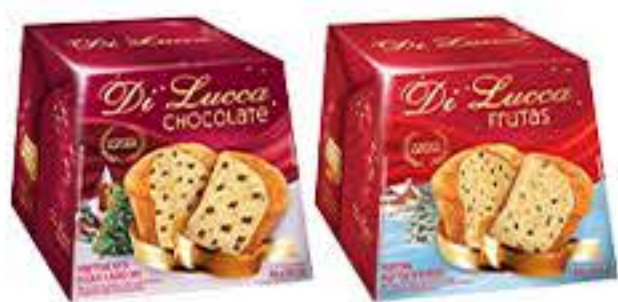
PANETONE DI LUCCA CHOCOLATE E FRUTAS 400G R$ 11,95