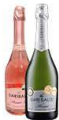
ESPUMANTE GARIBALDI MOSCATEL 750ML ROSE/BRANCA R$ 24,98