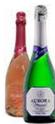
ESPUMANTE AURORA MOSCATEL 750 ROSE/BRANCA R$ 26,98