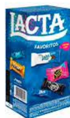
BOMBOM LACTA CAIXINHA R$ 10,98