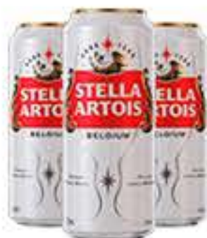
CERVEJA STELLA ARTOIS 473ML LATÃO R$ 4,75