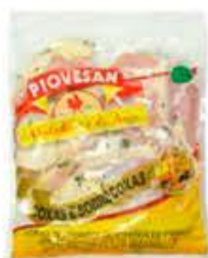
COXA E SOBRECOXA TEMPERADA PIOVESAN RESFRIADA 1 KG R$ 9,98