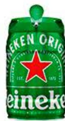
CERVEJA HEINEKEN 5L BARRIL R$ 99,98