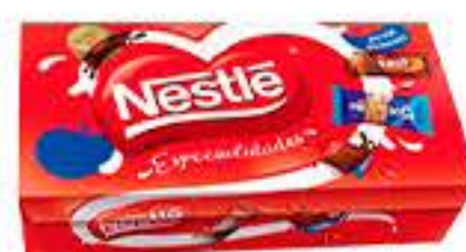
BOMBOM NESTLÉ CAIXINHA R$ 9,98