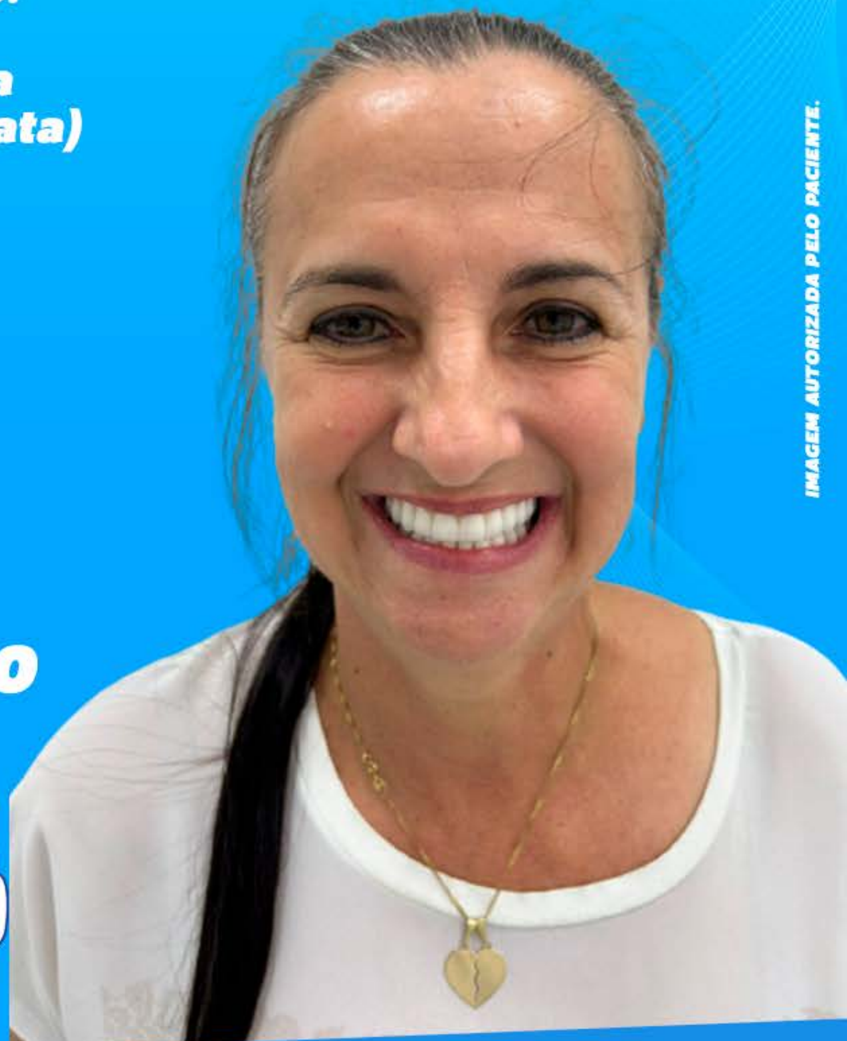
IMAGEM AUTORIZADA PELO PACIENTE.

FAÇA COMO ELA VENHA FAZER UMA AVALIAÇÃO 📞 55 9.8474-2020