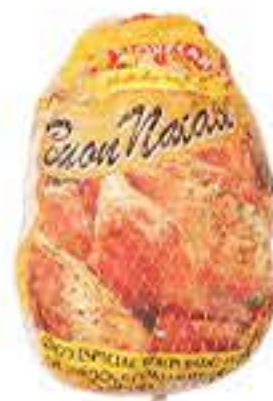
AVE PIOVESAN BUON NATALE KG R$ 10,88