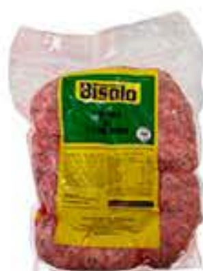
LINGUIÇA SUÍNA BISOLO COM TEMPERO VEDE KG R$ 16,98