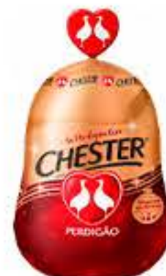
CHESTER PERDIGÃO INTEIRO KG R$ 27,95