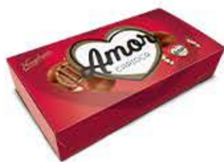
BOMBOM AMOR CARIOCA 200G R$ 6,99