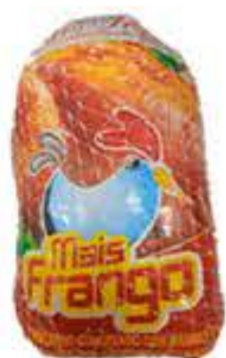
AVE MAIS FRANGO TEMPERADA KG R$ 9,98