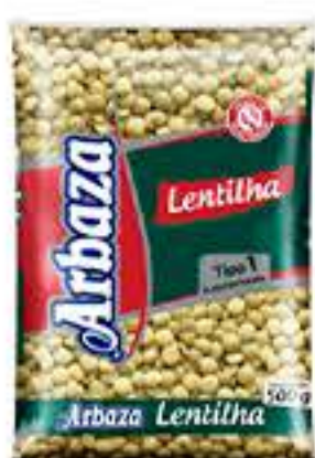
LENTILHA ARBAZA TIPO 1 500G R$ 6,98